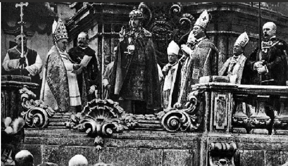
IV. Károly király eskütétele 1916. december 30-án

A királykoronázás századik évfordulóján a prédikációban és a szentmisét követő előadásokban dicsérték Boldog IV. Károly példamutató személyiségét, aki egyszerre volt istenfélő, katona, politikus és családfő is. IV. Károly és Pármái Zita gyümölcsöző házasságból nyolc gyerme-