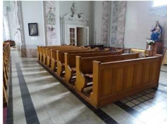
bal oldali részében lévő padegységek