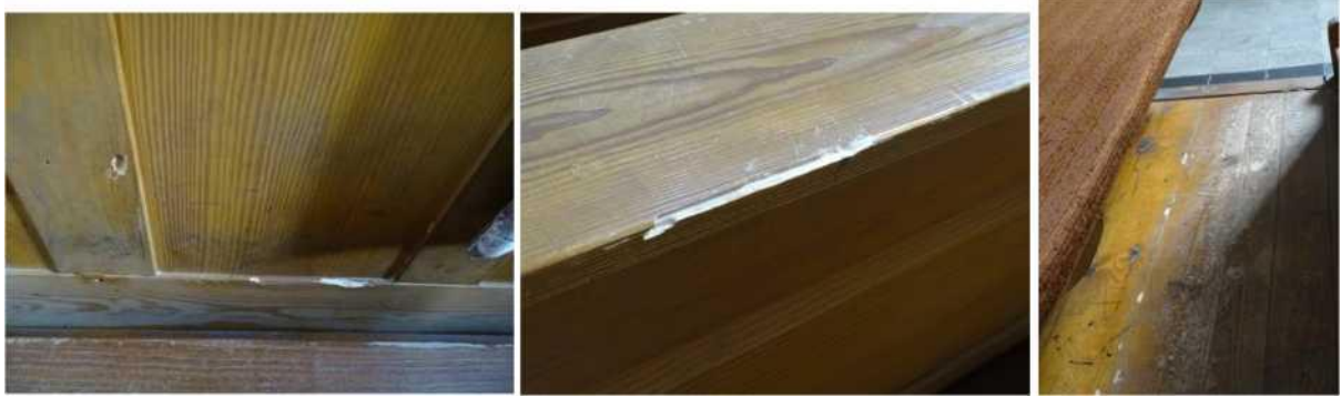
Aktív rovarfertőzés, gyakorlatilag minden pad érintett mindkét oldalon