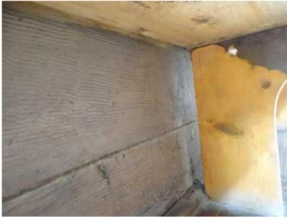
A padok ülő része csapolással erősített a padvégekbe, alul támaszokkal ellátott.