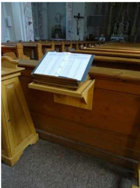
A jobb oldali padegység utolsó sorának hátfalelemére utólagosan könyvtartót szereltek.