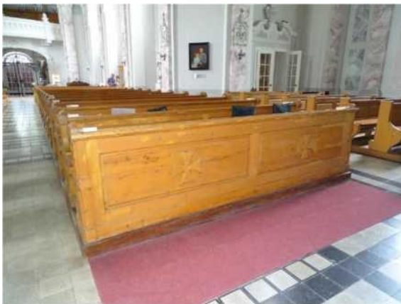
A mellvéd és a hátfal keretbetét szerkezetű, 2-2 betéttel. A mellvéd betéteinek közepén 1-1 talpas kereszt.