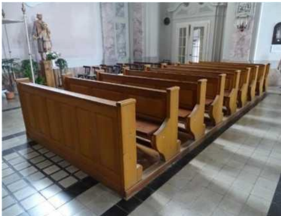
A kereszthajó jobb oldali és